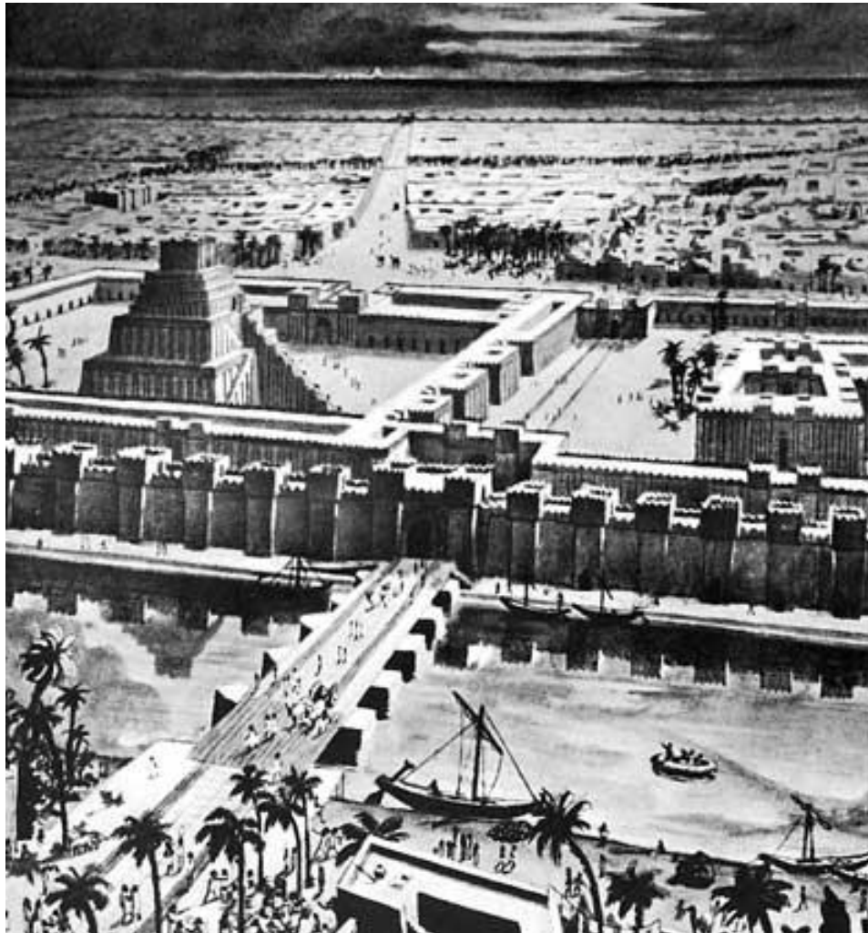
Rekonstruktion des Stufenturms mit Umgebung (aus dem Babylonheft des Informationsministeriums, Bagdad, 1972)