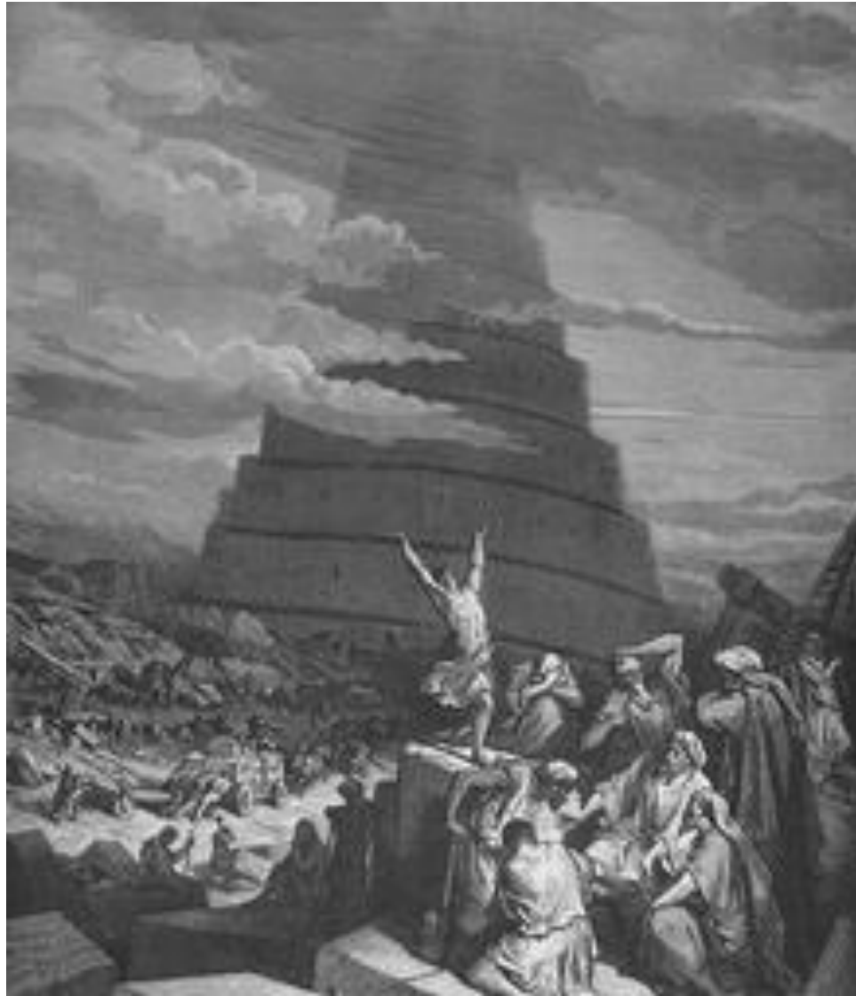
Turmbau zu Babel, Gustave Doré (1865).