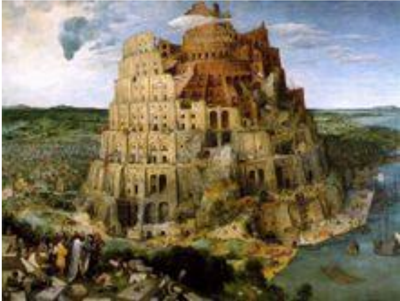
Der Turm zu Babylon von Pieter Brueghel d.Ä. (1563) Kunsthistorisches Museum Wien